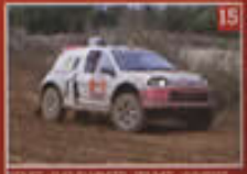
MOLET GILBERTO BLANC HANAU