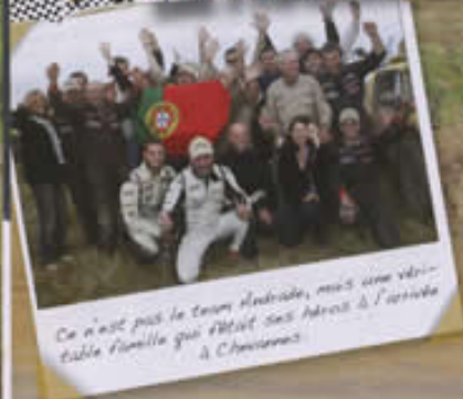
Ce n'est pas le team Andrade, mais une véritable famille qui fêlait ses héros à l'arrivée à Châteauneuf.