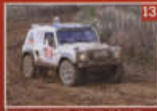
PAULS DETROIT DENARD GUYARD