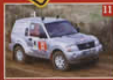
BRESLE MERTZ HROD

VOUS OFFRE LE CLASSEMENT GÉNÉRAL DES 24 HEURES DE FRANCE